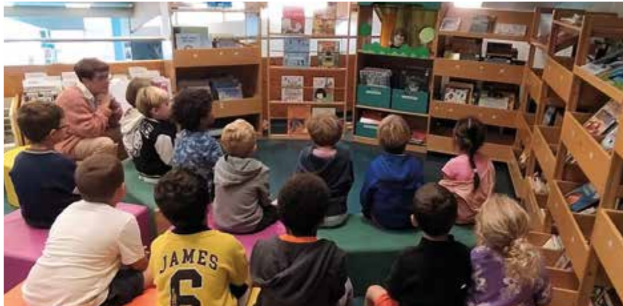
Les grandes sections de maternelle Vessiot et La Culasse ont assisté à un spectacle de marionnettes sur le pouvoir de la lecture dont le texte et les décors ont été réalisés par les bibliothécaires