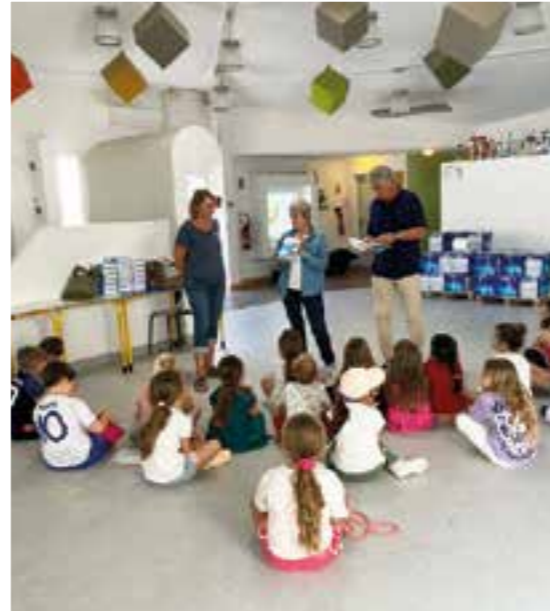
Jeudi 5 octobre, les élus délégués aux affaires scolaires se sont rendus dans nos écoles. À la Culasse, ils ont offert 32 dictionnaires aux CE1 et 67 ont été distribués aux CE1 de l'école Vessiot.