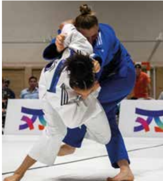
Mercredi 27 septembre, le gymnase de l'Espace Albert Giraldi accueillait une rencontre par équipe de la ligue professionnelle de judo. L'OM judo qui recevait AUXERRE judo l'a remporté 8 à 1!