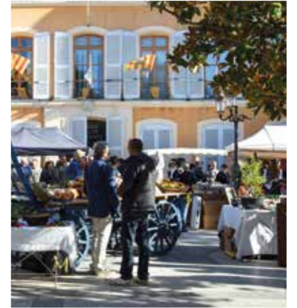
Le succès que rencontre RURALIA tous les ans est le fruit d'un travail de longue haleine des membres de son association auquel s'ajoutent les nombreux partenaires. Cette année encore, ce sont 30 000 visiteurs qui étaient réunis à Gémenos pour fêter notre terroir, les animaux et la Provence.