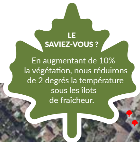
Projet de végétalisation du centre-ville

Ce travail dont les études sont en cours n'est pas figé. Nous restons bien évidemment à l'écoute des administrés qui auraient des idées à nous soumettre.