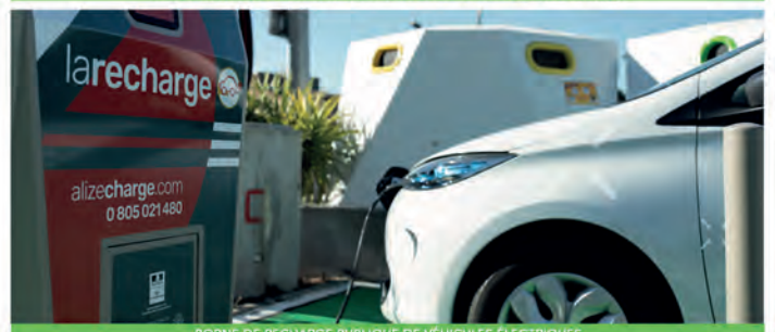
BORNE DE RECHARGE PUBLIQUE DE VÉHICULES ÉLECTRIQUES