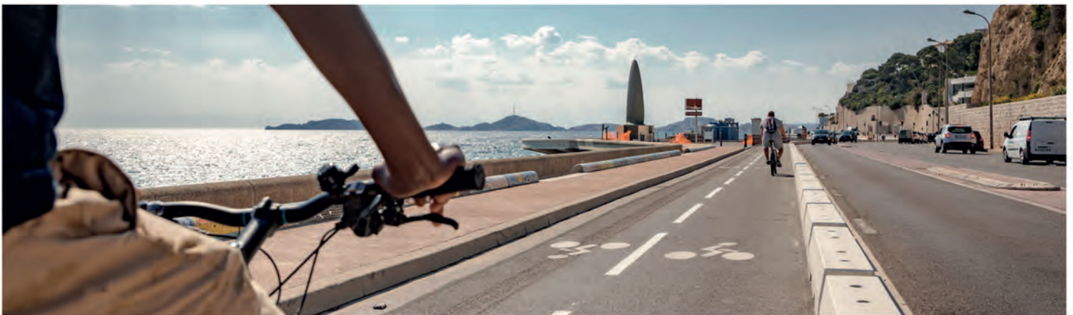
PISTE CYCLABLE CORNICHE KENNEDY - MARSEILLE