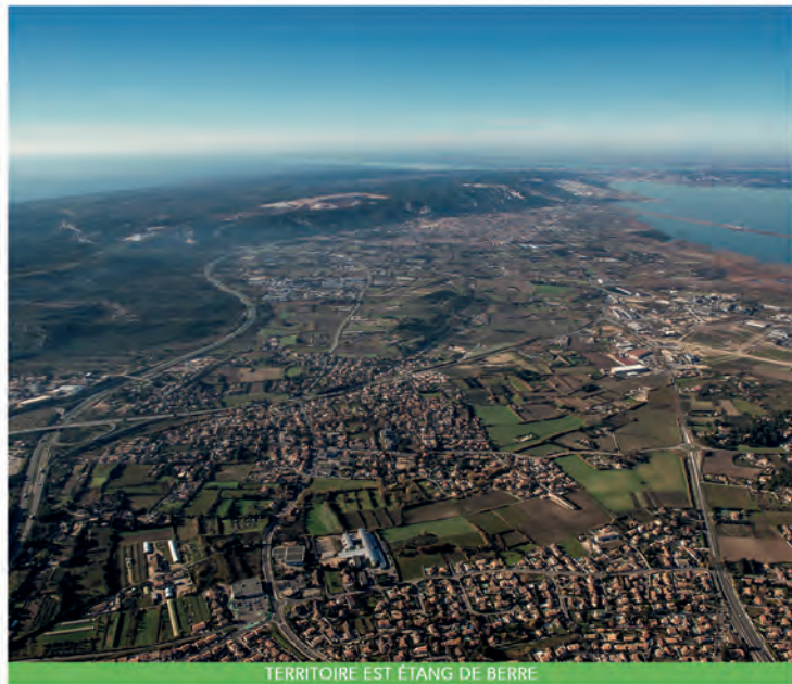
TERRITOIRE EST ÉTANG DE BERRE