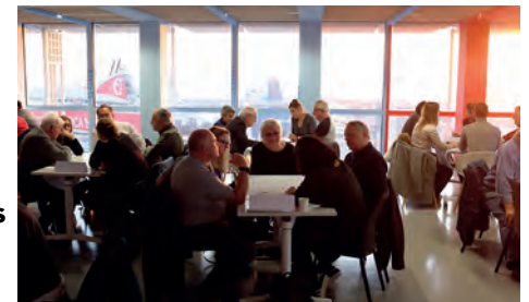
CONCERTATION PUBLIQUE ELABORATION PDU 2020-2030 AIX-MARSEILLE-PROVENCE ATELIER

➤ Lancée en 2018, le processus s'est achevé en octobre 2019.