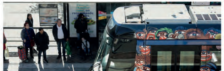
LE TRAMWAY D'AUBAGNE. UNE LIGNE DU RÉSEAU EXPRESS MÉTROPOLITAIN