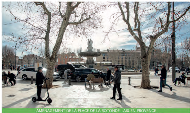
AMÉNAGEMENT DE LA PLACE DE LA ROTONDE - AIX-EN-PROVENCE